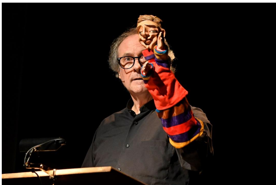
Fotografia de Iñigo Royo